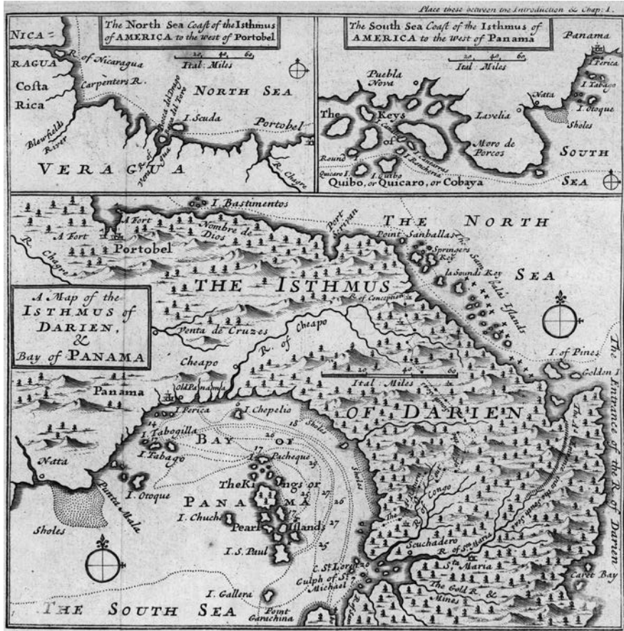
FIGURA 3. A Map of the Isthmus of Darien & Bay of Panama.

Fuente: Herman Moll, 1699, en Wafer, 1699. 50