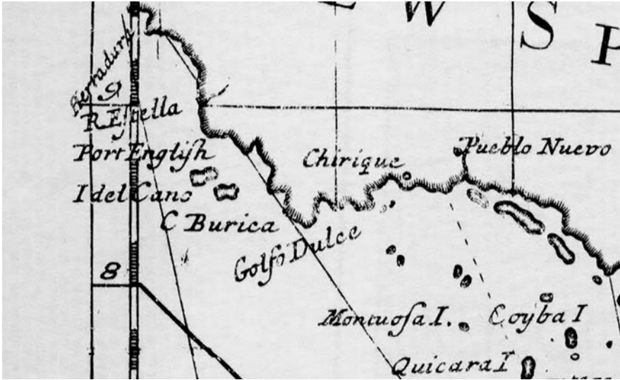
FIGURA 4. The Pacific or the South Sea (Extracto).

Al finalizar la guerra de Sucesión y firmarse los tratados de Utrecht (1713) los ingleses redujeron sus incursiones por el Pacífico americano pues en gran medida concentraron sus intereses en el comercio que se les había permitido llevar a cabo en Veracruz y Portobelo. 54 No obstante, continuaron realizándose algunos viajes en el marco de nuevos conflictos, como se vio en 1719 con la expedición de John Clipperton y George Shelvocke luego de iniciar la guerra de la Cuádruple Alianza. 55 Pero fue tras estallar la guerra del Asiento o de la Oreja de Jenkins (1739-1748) 56 cuando se lanzó un nuevo ataque que, a diferencia de expediciones previas, se trató de un avance con carácter más oficial en el que la misma monarquía se involucró y encargó a la armada inglesa llevar a cabo formalmente la ocupación de algún territorio centroamericano. El plan fue atacar Portobelo al mismo