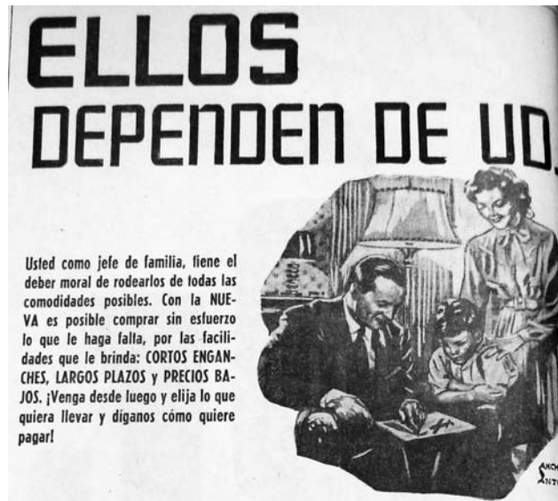
3. Detalle anuncio: "Ellos dependen de Ud.", Novedades , 3 de junio de 1947, p. 10