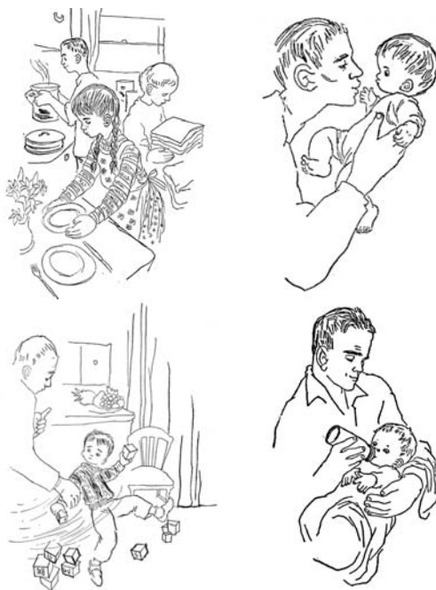
2. Collage. Matsner Gruenberg, 1956