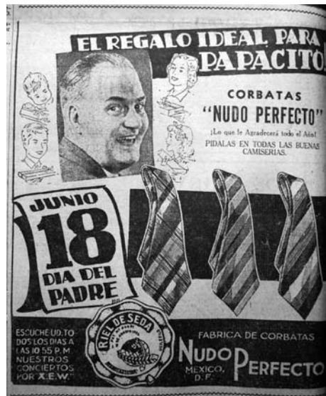
5. “El regalo ideal para papacito”, El Universal , 14 de junio de 1938, p. 4

La figura del hombre blanco, regordete, calvo sin bigote y casi en su cuarta década de vida se alejaba de ciertos ideales de atractivo masculino de la época. A su alrededor, aparecían dibujados su esposa y sus tres hijos, cada uno sosteniendo una caja envuelta para regalo. La sinergia radio-prensa se advertía en la esquina inferior izquierda del anuncio, en donde podía leerse: “escuche usted todos los días a las 10:55 p.m. nuestros conciertos por XEW”, ya que muchos programas de radio estaban financiados por empresas y gran parte de sus espacios se aprovechaban para publicidad.