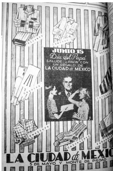
6. “Junio 15, Día del Papá”, El Universal , 10 de junio de 1942, p. 2

postura corporal que refleja alguna cercanía con su padre, pues apoya su mano izquierda sobre el hombro de su progenitor. En contraste con los anuncios publicitarios de las siguientes décadas y que analizaré más adelante, en éste se advierte, a nivel de representación, todavía cierta distancia entre padre e hijos y ninguna referencia a la relación del hombre con un ámbito doméstico.