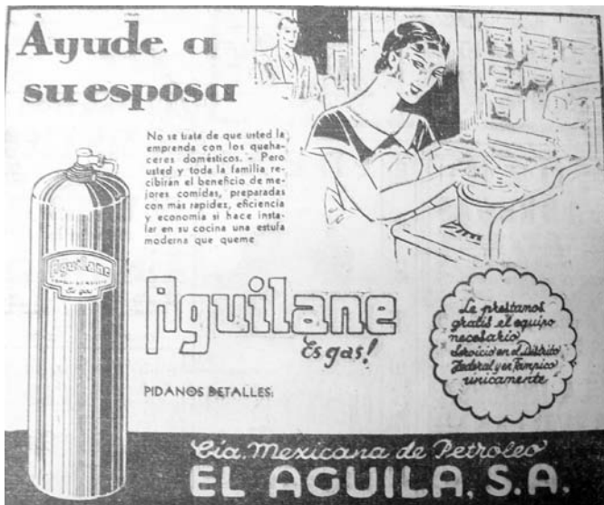
1. “Ayude a su esposa”, Excélsior , 19 de julio de 1936, p. 5

la editorial Daimon, edición que probablemente fue la primera que circuló en México.