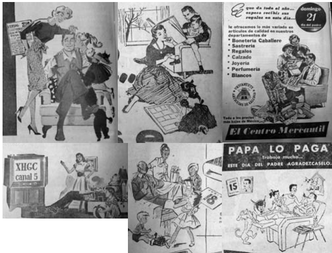
12. Detalle anuncios. El Universal , 15 de junio de 1950, p. 16; 9 de junio de 1953, p. 10; 18 de junio de 1953, p. 13; 4 de junio de 1958, p. 16; 8 de junio de 1958, p. 12; 16 junio de 1960, p. 48