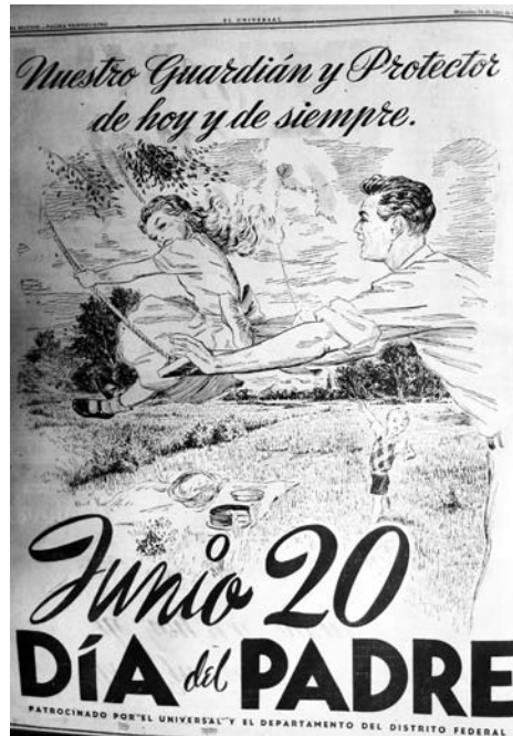
9. “Nuestro guardián y protector de hoy y siempre”, El Universal , 16 de junio de 1948, p. 24

su padre y un código de lectura parecería indicar que con esas monedas tendría que ir a comparar lo que le regalará. 69