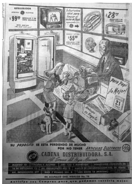
14. "Para Papi, lo mejor", El Universal , 14 de junio de 1953, p. 9

jerárquico del padre de familia que recibía atenciones y servilismo, pero simultáneamente transgredía lo que se entendía tradicionalmente por masculinidad.