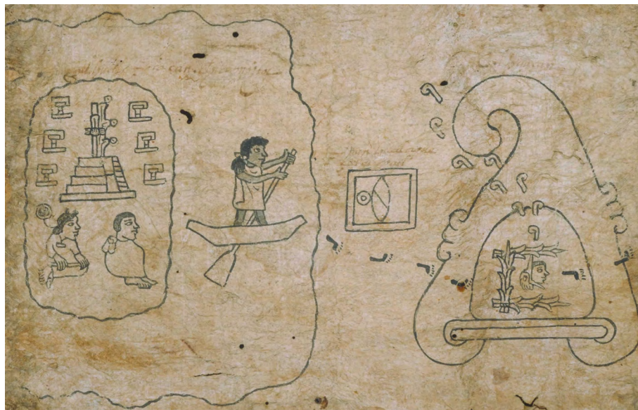
Figura 1. Inicio de la peregrinación de los mexicas. Lámina 1 de la Tira de la peregrinación o Códice Boturini

el de la migración de los mexicas y, en particular, el de la ubicación de los míticos Aztlan y Teocolhuacan.