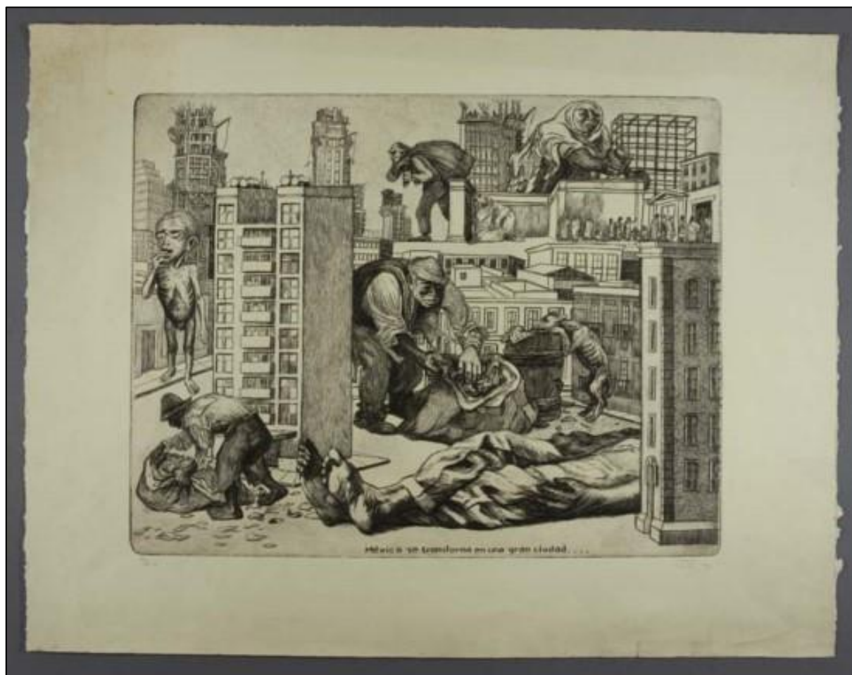
Figura 01. El Frankenstein urbano. Alfredo Zalce “México se transforma en una gran ciudad”, Grabado monocromático, 1947.