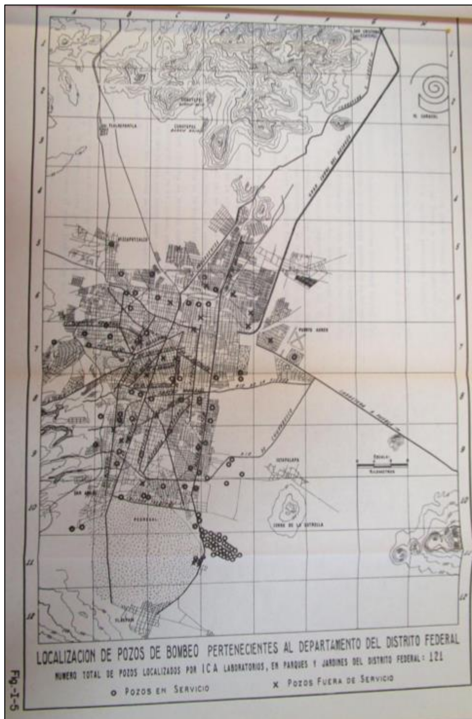
Figura 02. Distribución de pozos de bombeo de agua del DDF en el Distrito Federal, julio de 1952.