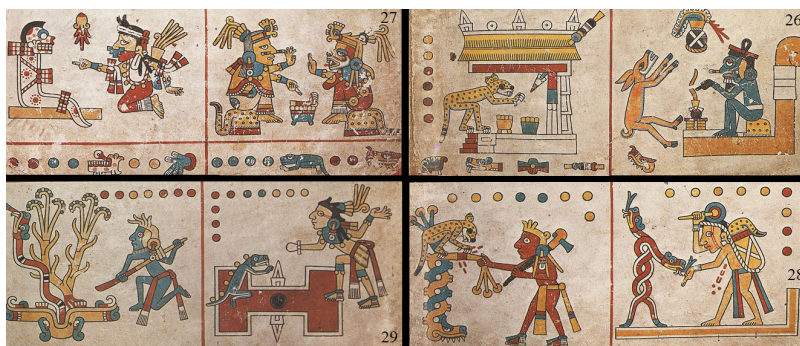
Imagen 3 - Códice Fejérváry-Mayer , láminas 26-29, bandas inferiores: composición elaborada por el autor a partir del Códice Fejérváry-Mayer (1971).

Dos años después de la aparición del artículo de Seler, la historiadora norteamericana Zelia Nuttall publicó en los Anales del Museo Nacional de México una reseña crítica del artículo del sabio alemán. Nuttall, defensora de un “bisiesto náhuatl” de 13 días cada 52 años, hizo notar que Seler no había citado en su estudio la autoridad de Serna: