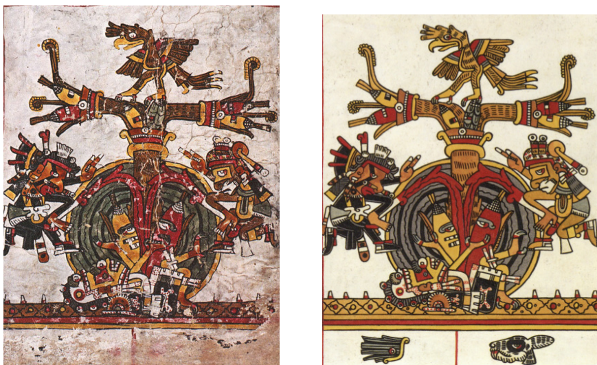
Imagen 1 - Códice Borgia , lámina 53, cuadro inferior derecho: A) Códice Borgia (1976) en original, los signos tochtli y cozcaquauhltli indicados por Fábrega en la parte inferior del cuadro están borrados. B) Díaz y Rodgers (1993): en esta reconstrucción, los autores identificaron el glifo de atl en lugar de cozcaquauhltli .

194 horas y media; o sean 8 días y 2 y media horas que tendrá de exceso el cómputo civil sobre el astronómico. Por tanto, cada 130 años el trópico se atrasa un día con relación al civil, y al cabo de 1040 años el atraso es de 8 días y 2 y media horas, que es necesario suprimir para igualar ambos cómputos. Se verá expresa la supresión en la mitad ya dicha de la página 53, señalada debajo con el carácter tochtli puesto enfrente al cozcaquauhltli , los cuales distan entre sí 8 caracteres en el orden ritual. (Fábrega 1899: 30-31).