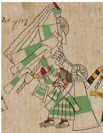
Figura 7. Códice borbónico , lám. 30, detalle. Fotografía del original. Fuente: Bibliothèque de l'Assemblée Nationale