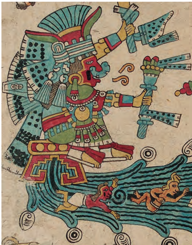
Figura 4. Códice borbónico , lám. 5, detalle. Fotografía del original.