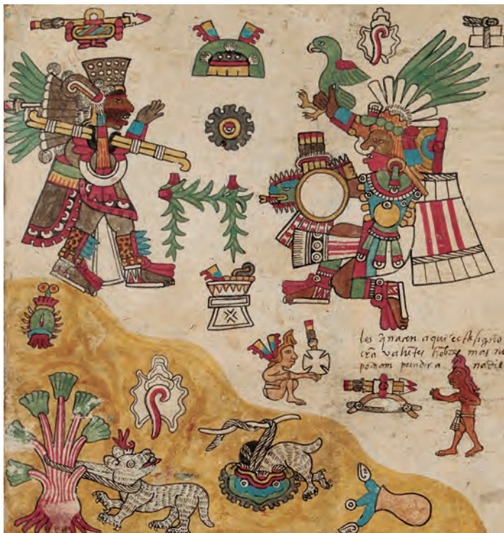
Figura 23. Códice borbónico , lám. 6, detalle. Fotografía del original.