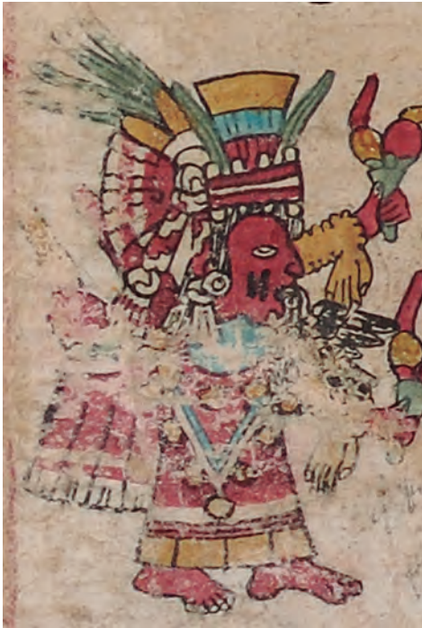
Figura 27. Códice borbónico , lám. 7, detalle. Fotografía del original.