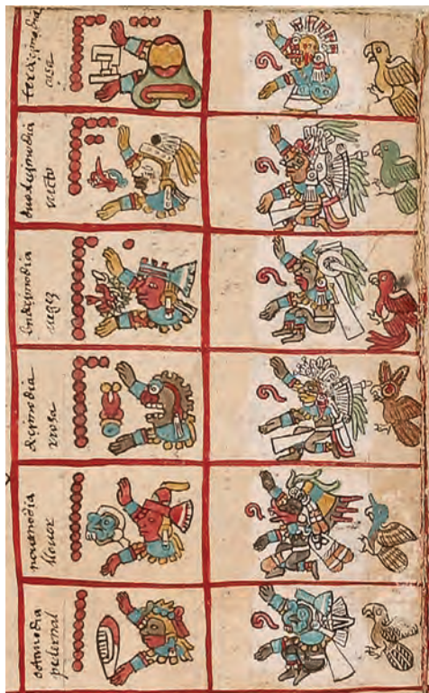
Figura 1. Códice borbónico , lám. 11, detalle. Fotografía del original.