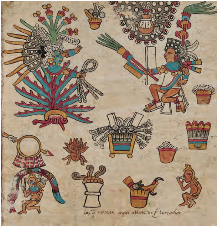
Figura 13. Códice borbónico , lám. 8, detalle. Fotografía del original.