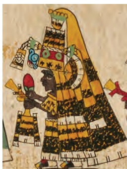
Figura 11. Códice borbónico , lám. 30, detalle. Fotografía del original.