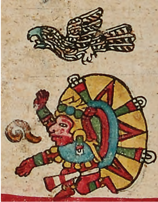
Figura 21. Códice borbónico , lám. 5, detalle. Fotografía del original.