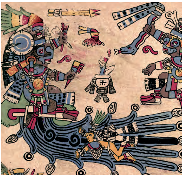
Figura 16. Facsímil del Borbónico de 1899, lám. 7, detalle.