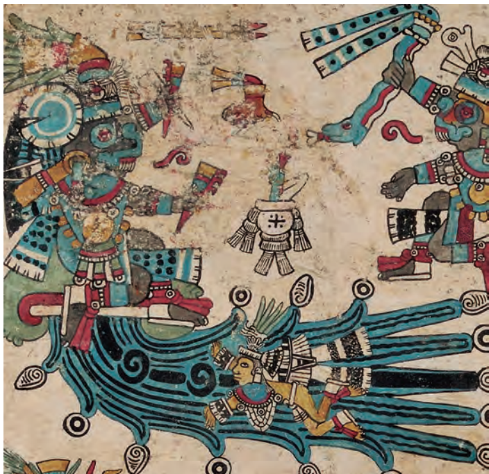
Figura 15. Códice borbónico , lám. 7, detalle. Fotografía del original.