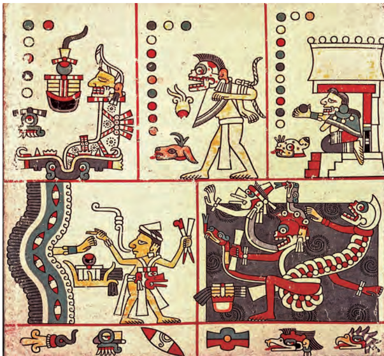
Figura 25. Facsímil del Laud de 1994, lám. 27.