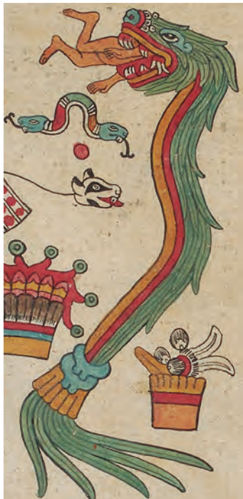
Figura 6. Códice borbónico , lám. 14, detalle. Fotografía del original.