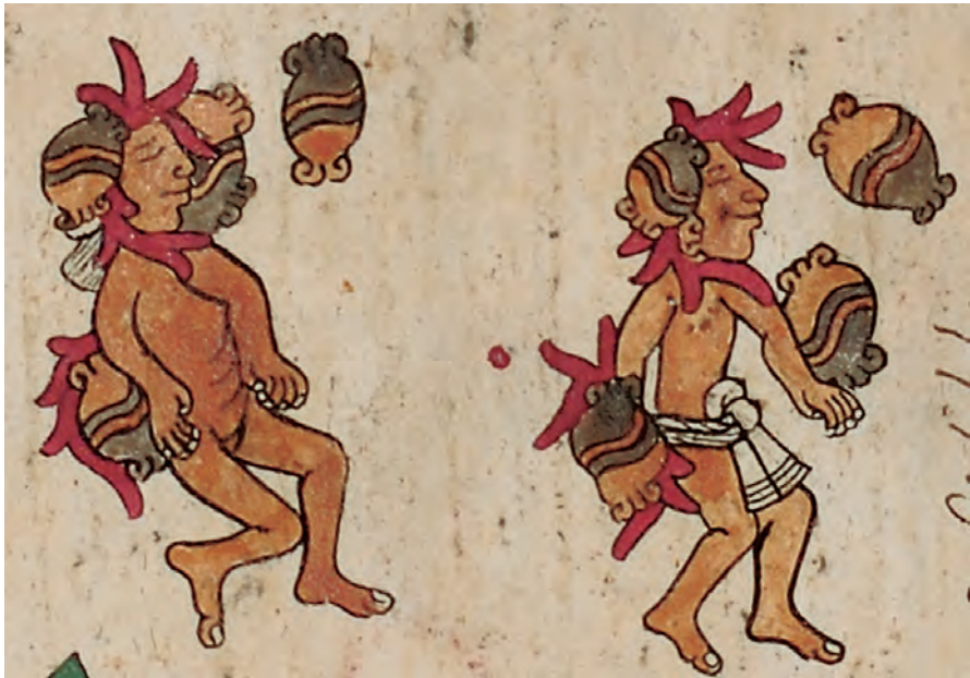
Figura 19. Códice borbónico , lám. 12, detalle. Fotografía del original.