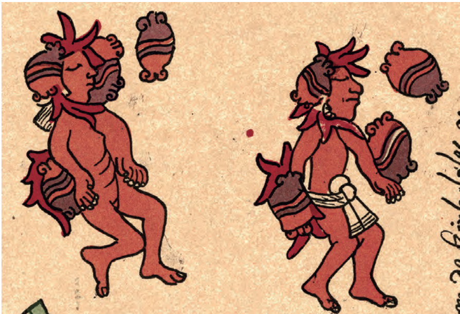
Figura 20. Facsímil del Borbónico de 1899, lám. 12, detalle.