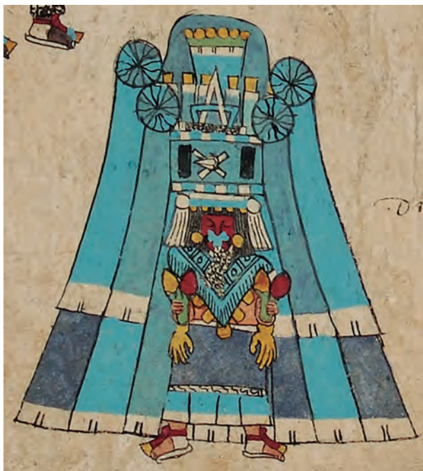
Figura 5. Códice borbónico , lám. 31, detalle. Fotografía del original.