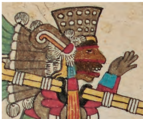
Figura 2. Códice borbónico , lám. 6, detalle. Fotografía del original.