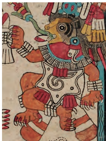
Figura 12. Códice borbónico , lám. 16, detalle. Fotografía del original.