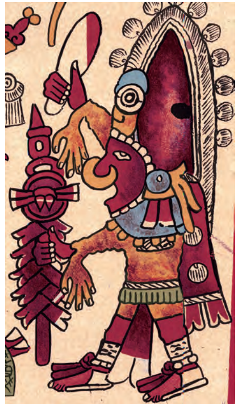
Figura 18. Facsímil del Borbónico de 1899, lám. 20, detalle.