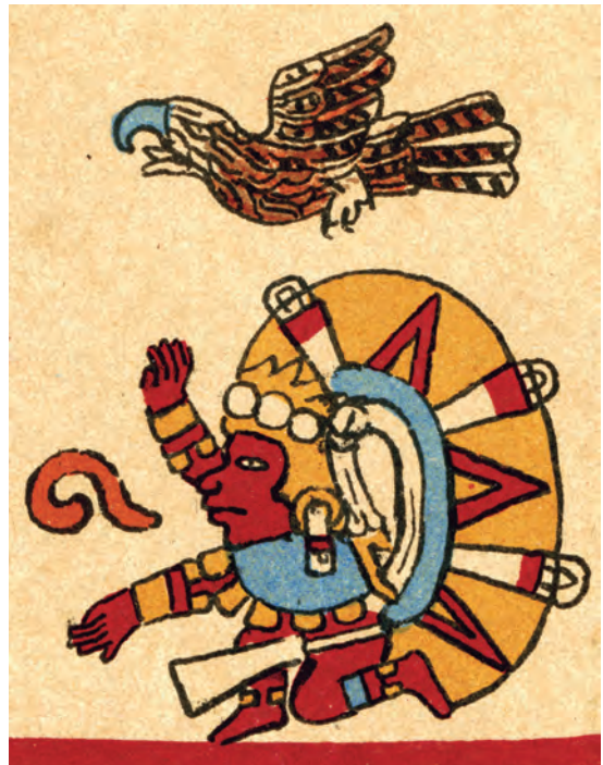
Figura 22. Facsímil del Borbónico de 1899, lám. 5, detalle. Fuente: Hamy, 1899