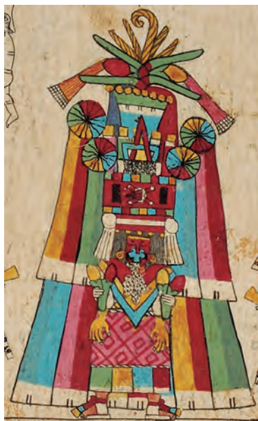
Figura 8. Códice borbónico , lám. 30, detalle. Fotografía del original.