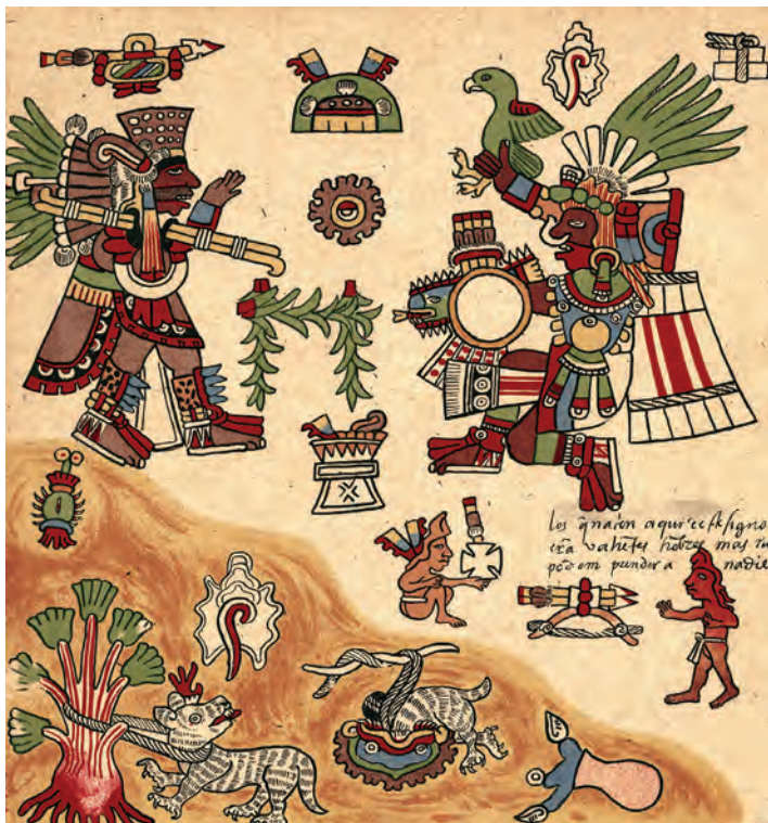
Figura 24. Facsímil del Borbónico de 1899, lám. 6, detalle.