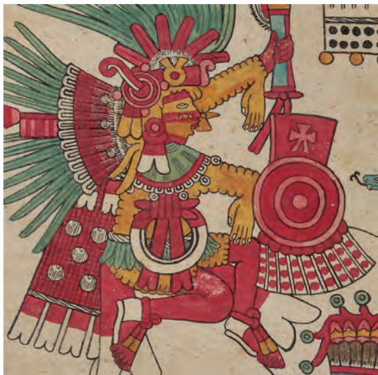
Figura 9. Códice borbónico , lám. 14, detalle. Fotografía del original.