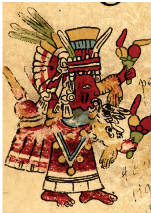
Figura 28. Facsímil del Borbónico de 1899, lám. 7, detalle.