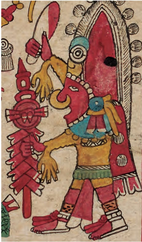
Figura 17. Códice borbónico , lám. 20, detalle. Fotografía del original.