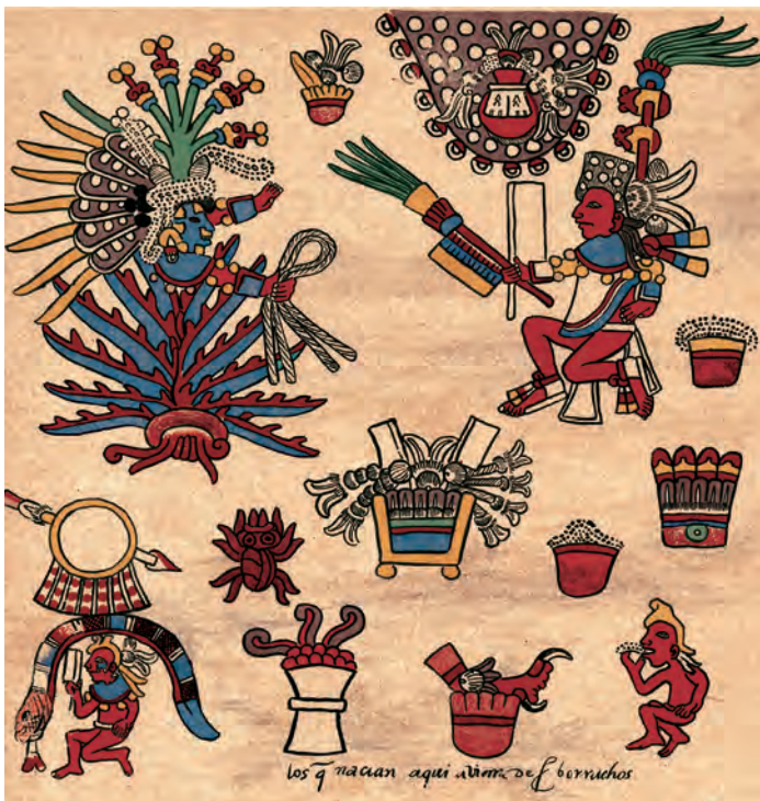
Figura 14. Facsímil del Borbónico de 1899, lám. 8, detalle.