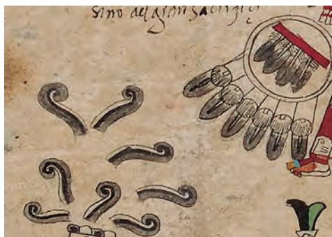
Figura 3. Códice borbónico , lám. 26, detalle. Fotografía del original.