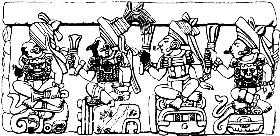
“Astrónomos” en los lados del Altar Q de Copán. Sur.

na, evangelización, políticas de las diversas órdenes religiosas, vinculación entre las comunidades estudiadas y sus reacciones ante las varias políticas misioneras, etcétera.