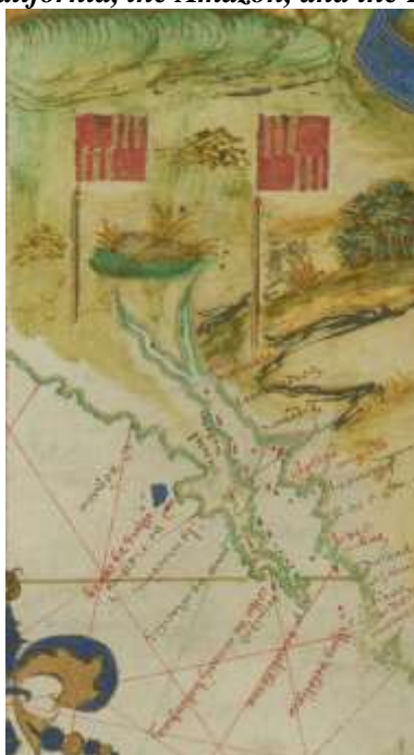
Fig. 2: Mapa António Pereira, 1545 (Extracto). Early representation of Newfoundland, Lower California, the Amazon, and the Ladrones.