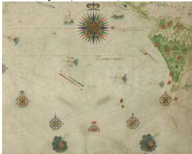
Fig. 5: (Extracto) Mapa António Pereira, 1545. Early representation of Newfoundland, Lower California, the Amazon, and the Ladrones.