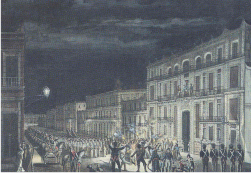
Agustín de Iturbide proclamado emperador en 1822, acuarela en seda de autor anónimo, sin fecha.

A la mañana siguiente, reunidos desde muy temprano, los diputados invitaron a Iturbide, quien se presentó en la sesión a las diez de la mañana junto con sus fieles, que entraron gritando vivas al emperador y mueras a los traidores. Al fin de un acalorado debate, 67 diputados contra 15 lo eligieron emperador constitucional. Dos días después —el 21 de mayo— Iturbide, aludiendo a que por nombramiento del Congreso era emperador de “Méjico”, juró ante ellos invocando a Dios y los Santos Evangelios que defendería la religión católica; que en todo lo que hiciera no vería sino por el bien y el provecho de la nación; que se subordinaba a los decretos del Congreso para exigir cantidad alguna de frutos, dinero u otra cosa; que no iba a tomarle a nadie sus propiedades y que iba a respetar la libertad política de la nación y la de cada individuo. Asentó al final que, si hiciera lo contrario a lo que había jurado, no debía ser obedecido. 26