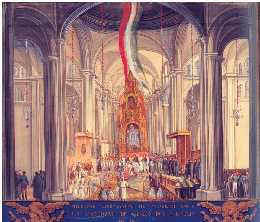
Coronación de Iturbide , acuarela en seda de autor anónimo, ca. 1822. Colección del Museo Nacional de Historia de la Ciudad de México, INAH

y la consagración de los reyes. Antes de los Evangelios, los obispos condujeron a Agustín y a Ana al pie del altar, donde los ungieron desde el codo hasta la mano del brazo derecho, para que después algunos funcionarios les secaran los restos del “santo crisma”.