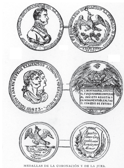
MEDALLAS DE LA CORONACIÓN Y DE LA JURA.