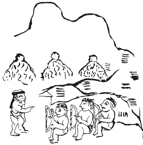
Figura 2. El señor tarasco Tariacuri da instrucciones a sus tres herederos de cómo constituir las tres capitales tras la derrota de sus enemigos. Frente a él escuchan su hijo Hiquíngare y sus sobrinos Tangáxoan e Hiripan. Relación de Michoacán , lám. 22.

Volvamos aquí a la mencionada diferencia entre téucyotl y tlahtocáyotl . Puede suponerse que la institución de la triple alianza tuvo como una de sus muy remotas causas la necesidad de armonizar intereses económicos de múltiples poblaciones heterogéneas. Como se dijo, en Mesoamérica se observan dos fundamentos muy diferentes de las relaciones de subordinación política: el primero, de orden gentilicio, al que puede denominarse “de sangre”, se basa en el supuesto parentesco de todos los componentes de un conglomerado por descender de un antepasado común de carácter mítico. Los gobernantes ocuparían el sitio de los “hermanos mayores”, y regirían con la autoridad de su linaje, llegando al punto de estar muy próximos al personaje divino ancestral. Se mandaba a todos los “parientes”, independientemente del lugar que habitaran. El otro sistema, que puede llamarse “territorial”, se basaba en el control del territorio, y el gobernante asumiría el papel de encargado divino de su distribución y administración. El poder se ejercería sobre todo aquel que ocupara dicho territorio, independientemente de su identidad de supuesta ascendencia, incluyendo la étnica. El sistema territorial era más desarrollado y complejo que el gentilicio; pero no lo había desplazado, sino que lo había incor-