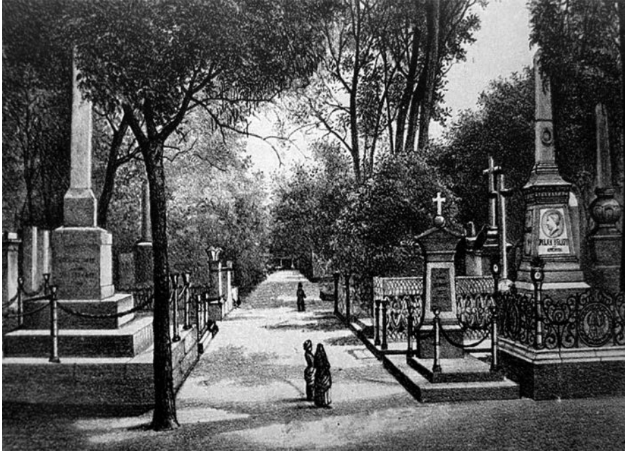
Figura 2. Panteón de la Piedad llamado “de los franceses” (1882). Rivera Cambas, M., México pintoresco, artístico y monumental (p. 395).

el más a propósito para el tradicional paseo, que solo en una minoría de casos servía para recordar la pérdida de las personas queridas o reflexionar en recogimiento sobre la ley ineluctable de la propia vida. La aglomeración en este y otros sitios similares en esa jornada también implicó, en muchas ocasiones, vetar la entrada del público visitante, con la consecuente y sincera queja de los menos, como la de Guillermo Prieto en 1868, quien apuntó que su paseo en ese año fue “bien triste”, entre otras cosas, porque esa orden pugnaba con las costumbres 81 . En 1875 fue inaugurado por una empresa particular un nuevo panteón en las colinas de Tacubaya, que fue llamado De Dolores y cuatro años después compró el gobierno del Distrito Federal, que terminó de pagarlo en 1880. Paulatinamente se agregaría a la lista de los más visitados el 2 de noviembre por mucha gente, sobre todo del pueblo mediano y bajo que, estando por terminar el siglo XIX, seguía yendo a los cementerios “en apiñados pelotones” dentro de coches particulares, de sitio, y sobre todo “en tranvías que arrojaban oleadas de pasajeros” 82 .