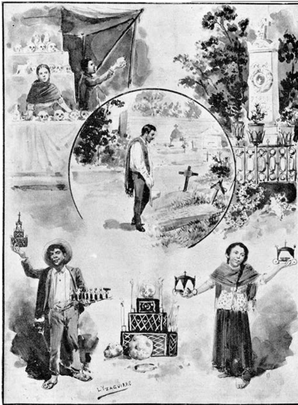
Figura 5. Costumbres del día de muertos (Yzaguirre, L., en El Mundo , noviembre de 1895).

les. Con respecto a nuestro tema, al menos en teoría, el 1 y el 2 de noviembre estaban en el calendario para mover el espíritu con el recuerdo de los seres que se fueron, lo que se había convertido en algunos en una actitud regida por normas morales, católicas, ilustradas y/o románticas. Fernández de Lizardi, por ejemplo, señaló la convicción de su época de que “se debía sentir” a los difuntos que amamos, reconociendo que se trataba de un civilizado sentimiento “natural y antiguo” 107 . El panteón de Santa Paula, según un cronista de 1844, excitaba en el alma del hombre pensador “nobles sentimientos de respeto y admiración” 108 . Para Carl Sartorius, en el México que él recorrió y con respecto a la muerte de los seres amados, era evidente que ni los indios ni los mestizos conocían “la plena amargura” del sentimiento lúgubre 109 . Ignacio Manuel Altamirano, por su parte, creía firmemente que el culto a los muertos nacía de “un sentimiento instintivo en el corazón humano”, que era el de honrar a los que ya no existen 110 , aunque también estaba consciente de que eran muy pocos los que en el México de sus días profesaban ese “culto del sentimiento”, que dio a entender como una actitud de “religioso respeto” y “de dulce tristeza” 111 . Hacia la segunda mitad de esa centuria, se había extendido que la sociedad viera como “ridículo, exagerado o loco” lo que sentían poquísimos en el proceso de duelo de sus difuntos 112 , talante que por extensión también permeó el 2 de noviembre.