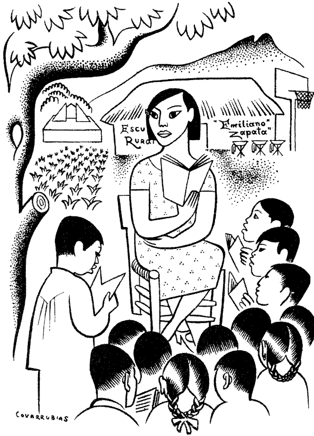
A RURAL SCHOOL