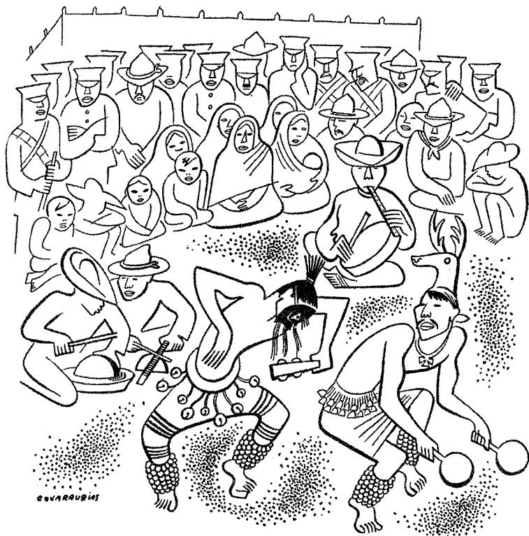
DEER DANCE OF THE YAQUI INDIANS

FUENTE: FRANK TANNENBAUM, Peace by Revolution .