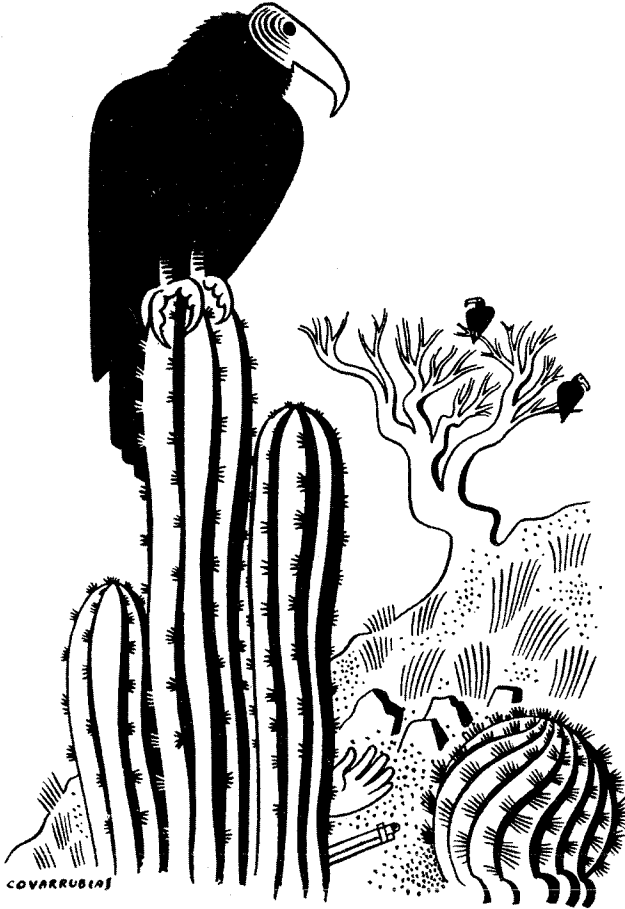
Figura 6 El último ganador de cualquier batalla