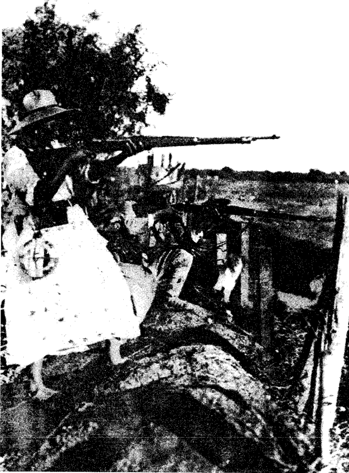
Figura 5 Mujeres yaquis ayudando a los suyos

FUENTE: FRANK TANNENBAUM, Peace by Revolution .