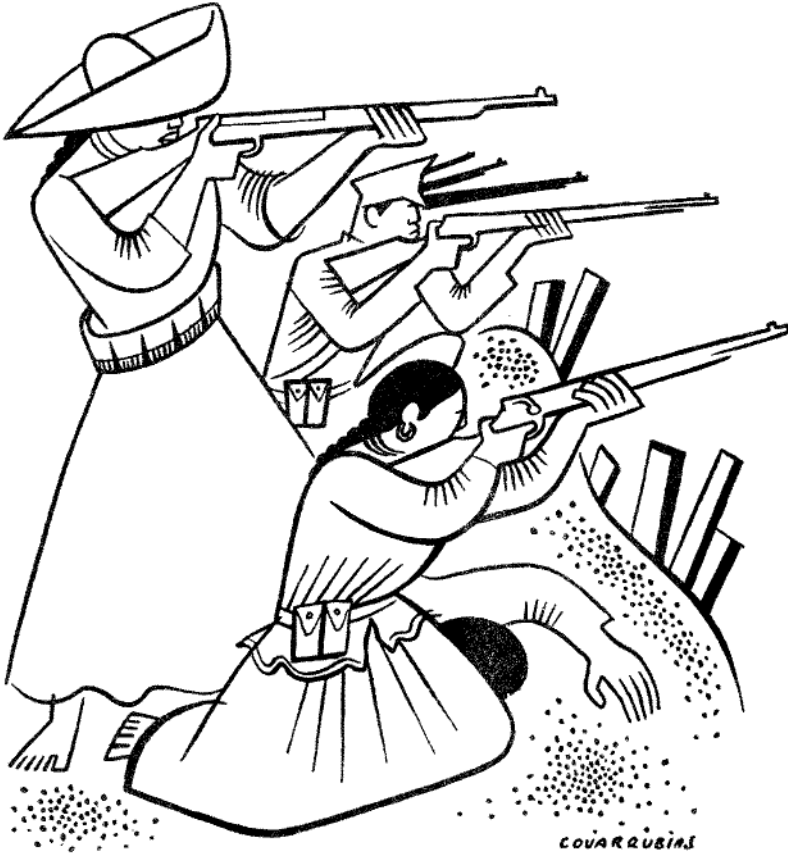
SOLDADERAS IN THE REVOLUTION