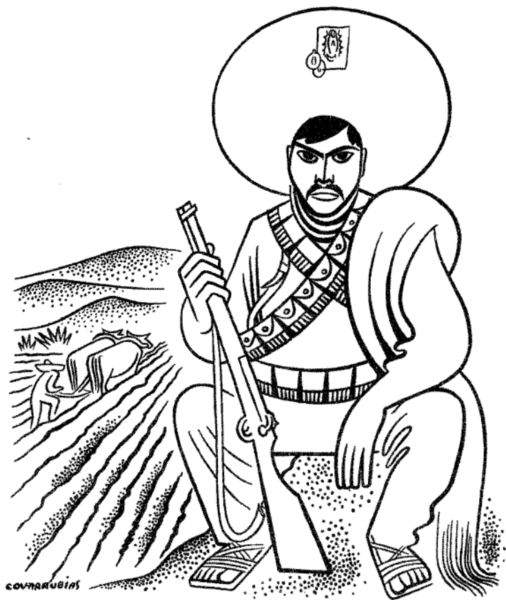
Figura 8 Agrarista vigilando su tierra recién conquistada