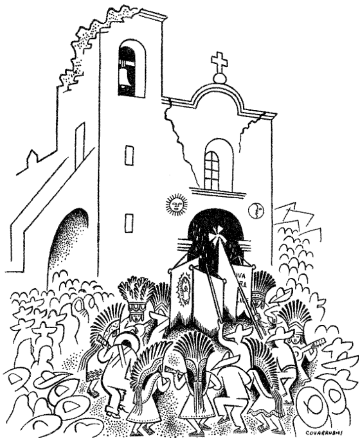
"THE MOORS AND THE CHRISTIANS" A religious dance