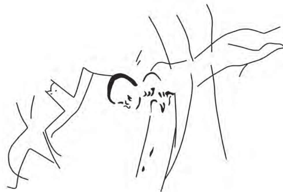
FIGURA 1. «HOMBRE HERIDO» DE PECH MERLE, TOMADO DE LÉROI GOURHAN (1969). (PG. 3).

de persecución o enfrentamiento con grandes bóvidos (Léroi-Gourhan 1969:98, 240); pero, a excepción del ‘hombre herido’ de Pech Merle, el ‘hombre muerto’ de Cosquer y la silueta con posibles saetas de Cougnac (véanse figura 1; Léroi-Gourhan 1969:242; Clottes, Courtin y Varell 2005:29), no parece común que las imágenes sugieran el momento mismo de la defunción. Carecemos, además, de figuraciones de esqueletos —a excepción, tal vez, de los supuestos cráneos de caballo descarnados en el arte mobiliario de Teyjat y Mas d’Azil (Testart 2016:54, 56)—, huesos o cuerpos en descomposición y no disponemos de ninguna representación explícita que pudiera ayudarnos a la plena reconstrucción de una escatología. Es, simplemente, como si los hombres del Pleistoceno hubieran querido borrar la muerte humana.