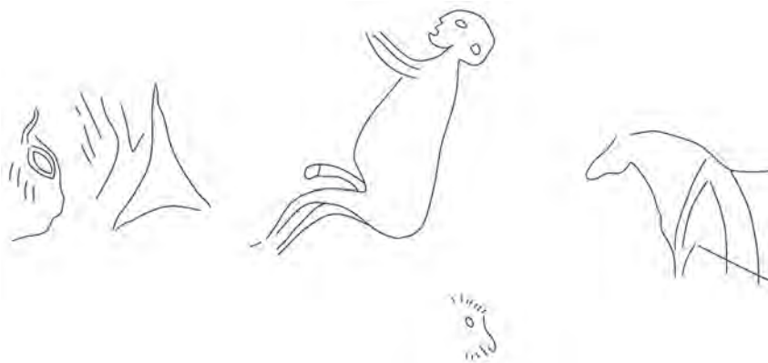
FIGURA 6. «LE SORCIER» DE SAINT-CIRQ, TOMADO DE LÉROI-GOURHAN (1969). (PG. 10).