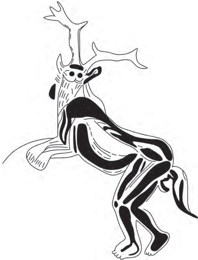
FIGURA 5. «LE SORCIER» DE TROIS FRÈRES, TOMADO DE WIKIPEDIA. (PG. 10).