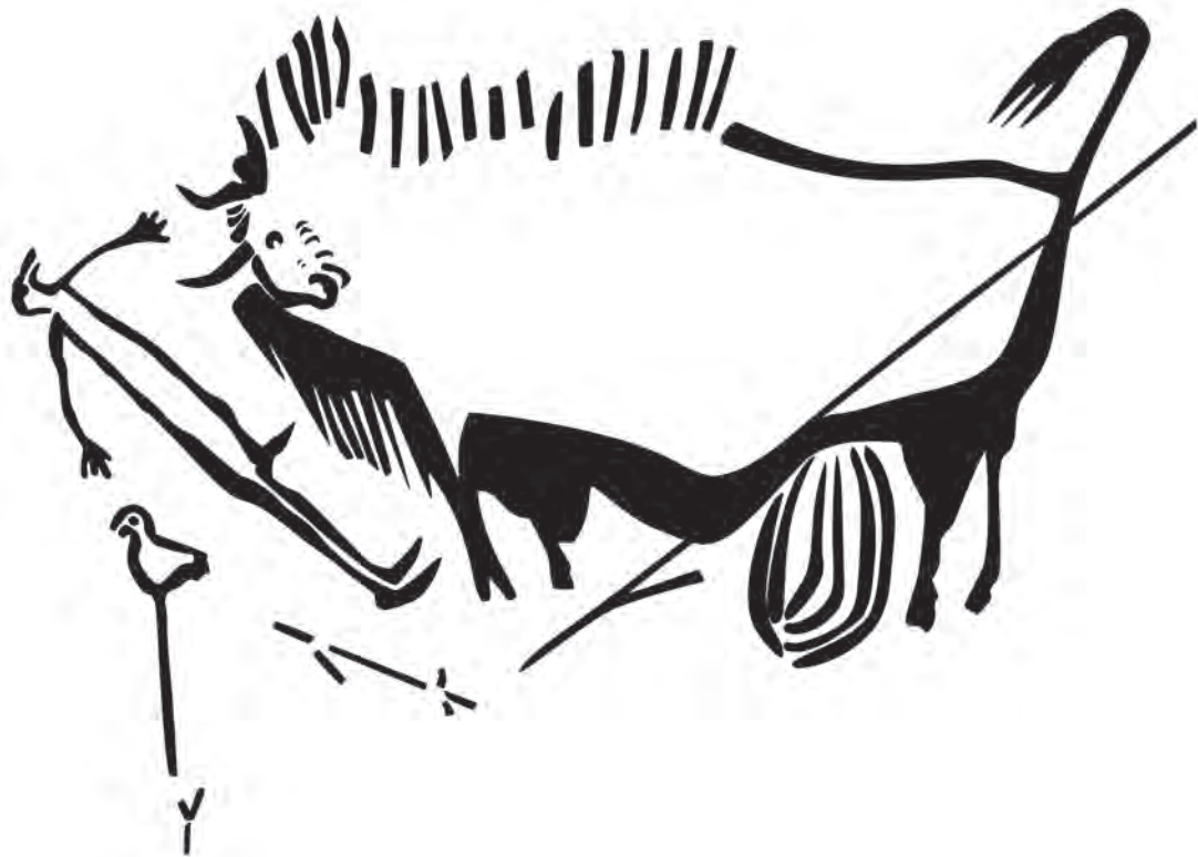
FIGURA 3. ANTROPOMORFO ‘ENFRENTADO’ A UN BISONTE, ESCENA DE LASCAUX TOMADA DE LÉROI-GOURHAN (1969). (PG. 7).