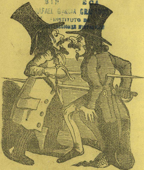
La razon de un duelo.

BIP ESCA RAFAEL GARCIA GRA INSTITUTO DE INVESTIGACIONES HISTORICAS