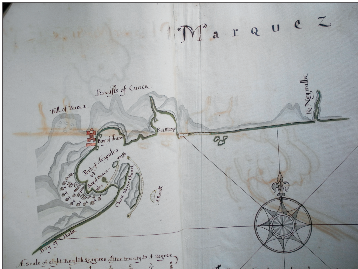
Figura 3. Marquez (Hack, 1698: s/p John Carter Brown Library Codex Z 6 / 3-SIZE).

From the port & bay of Mosquitos to mount Bernall is 7 leagues from this mount begins the Gulf of Tehuantepeque, this Gulf extended by land 40 leagues to the other side of the City of