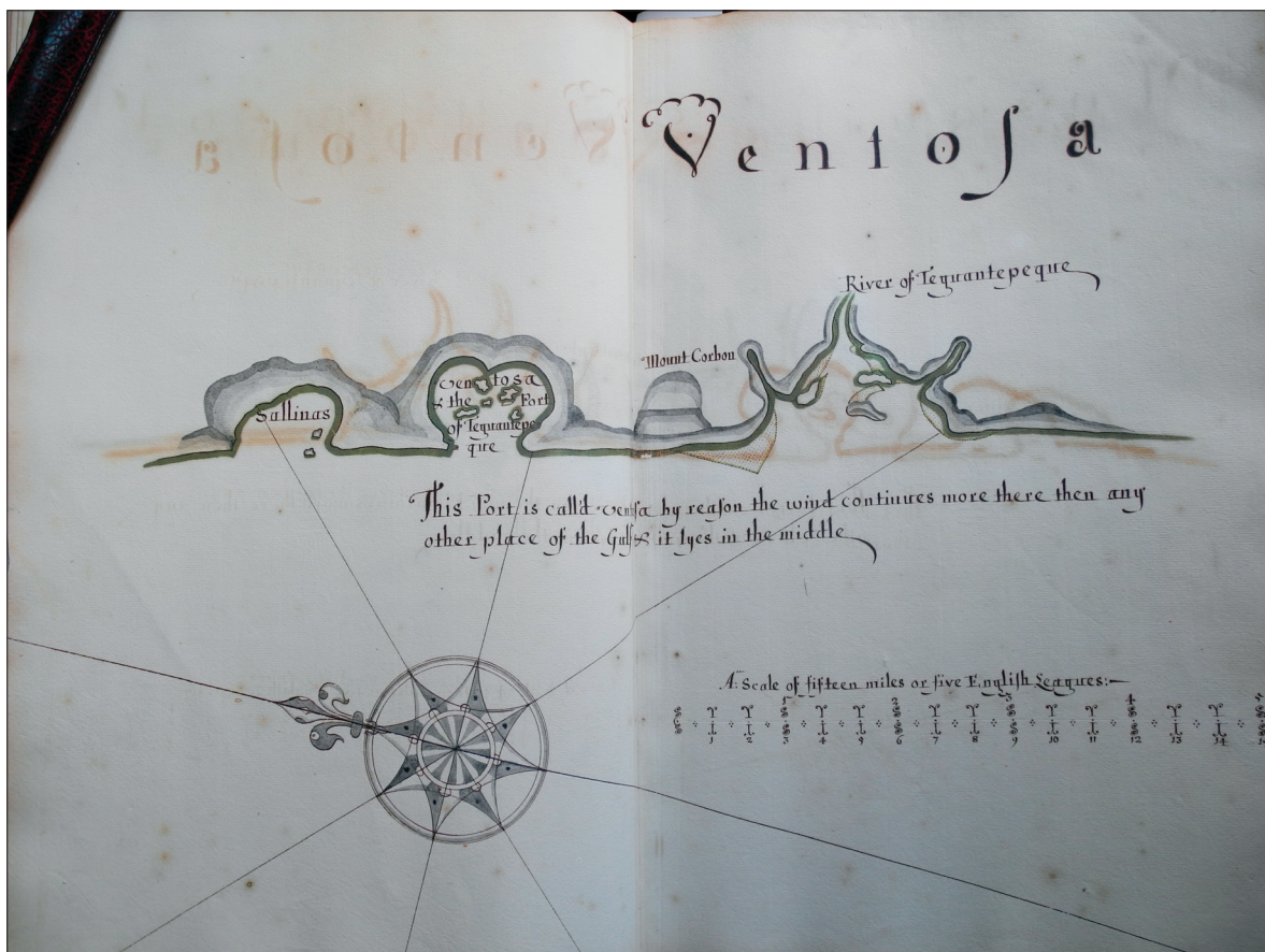
Figura 4. Ventosa (Hack, 1698: s/p John Carter Brown Library Codex Z 6 / 3-SIZE).

Como ha podido verse, los trabajos de Ringrose y Hack no únicamente mostraron los avances ingleses por el Mar del Sur, sino que formaron parte de la transformación cartográfica que se gestaba en la Gran Bretaña. Debido a las crecientes navegaciones inglesas se hizo necesario depender menos de los mapas neerlandeses y elaborar una cartografía propia que respondiera a las necesidades de las nuevas exploraciones, además de mostrar los