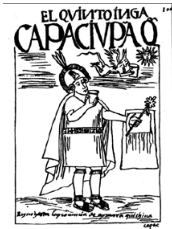
Figura 11. El quinto Ynga, Capac Yupanqui Ynga, f. 100 [100].

Las imágenes de los vicios y las virtudes incas pueden encontrar dificultades para ser reconocidas exclusivamente. Aunque para Guaman las virtudes del cuerpo se relacionan con las del alma, los retratos de los doce incas, las doce coyas y de los señores y señoras de los cuatro suyus , difícilmente dan cuenta del carácter de cada uno de ellos. Los siguientes casos solo intentan ejemplificar la dificultad de seguir, mediante un análisis estructuralista de la disposición de las formas, las asociaciones que Guaman hace entre diferentes vicios y virtudes respecto al cuerpo y, por ende, la indispensable necesidad de acudir a los textos. En el primer ejemplo, el retrato del Quinto Ynga (Figura 11), trasluce el juicio de Guaman, pues en la lámina correspondiente se representa a la idolatría por medio de un demonio alado que bebe al mismo