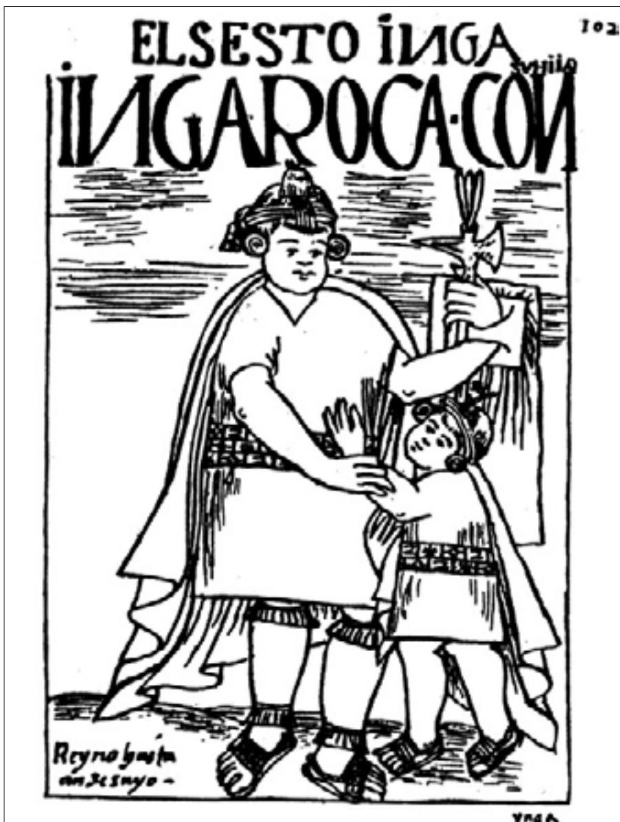
Figura 12. El sexto Ynga, Ynga Roca, con su hijo, f. 102 [102].

tiempo que lo hace el Inca Capac Yupanqui. 58 Su cuerpo, al que el autor describe como medianito, no da la clave para la evaluación moral del personaje. En otros casos, la complexión física sí da un atisbo de su carácter: Inca Roca es dibujado con complexión notablemente gruesa, casi gordo, y con su hijo de la mano 59 (Figura 12), y en la descripción, Guaman lo llama «gran xugador y putaniero, amigo de quitar hacienda de los pobres», 60 características que no se coligen del retrato, aunque pueden vincularse bajo el principio aristotélico de que las facultades morales