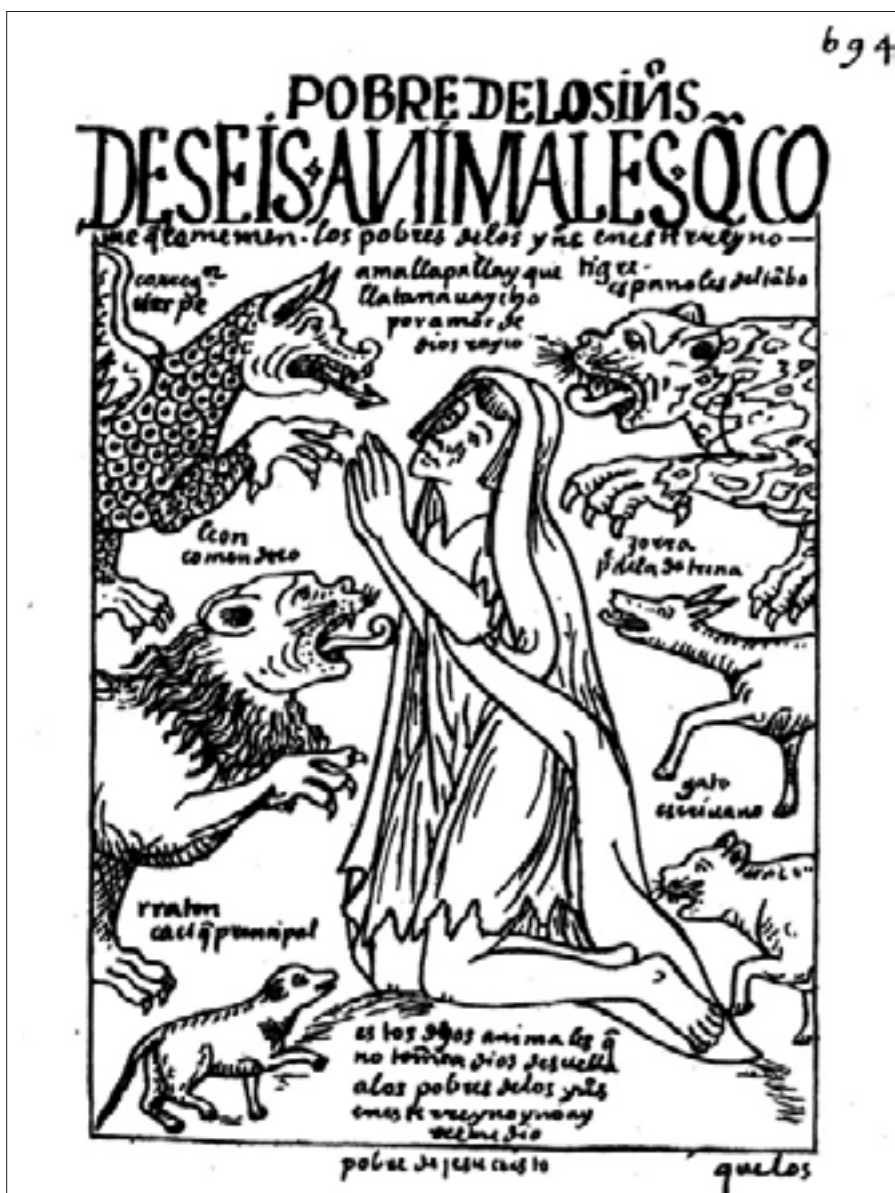
Figura 10. Pobre de los indios: de seis animales que comen que temen, f. 694 [708].

representa una cárcel inca como símbolo de la justicia que primaba durante su gobierno. La segunda, es una alegoría de la desesperada situación que vivían los pobres indios a expensas de los feroces funcionarios españoles. En ambos dibujos es posible ver a una persona que llora y que es asediada por una diversidad de animales, y hay una desdicha implícita. Una diferencia fundamental es que la primera tiene el fondo oscurecido y no así la segunda, lo que sugiere un ambiente cerrado. En la segunda, la actitud de la persona es de súplica mientras que en la primera parece de resignación. La primera imagen, folio 302 [304], inaugura el capítulo de la «JUSTICIA y castigos y preciones y