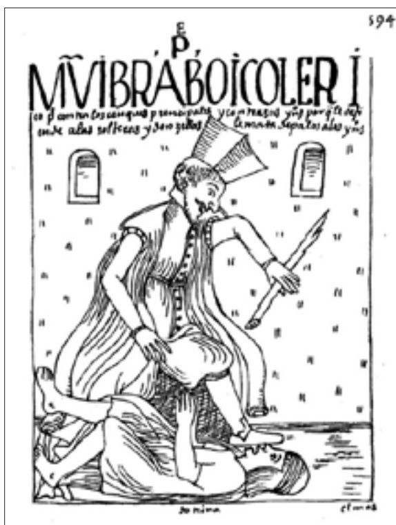
Figura 5. Muy bravo y colérico padre contra los caciques principales, f. 594 [608].

ancí andaua la tierra muy justa con temeridad de justicia y castigos y buenos egenplos. Con esto parese que eran ubidente a la justicia y al Ynga y no auía matadores ni pleyto ni mentira ni peticiones ni proculadrones [sic] ni protetor ni curador enteresado ni ladrón, cino todo uerdad y buena justicia y ley. 43