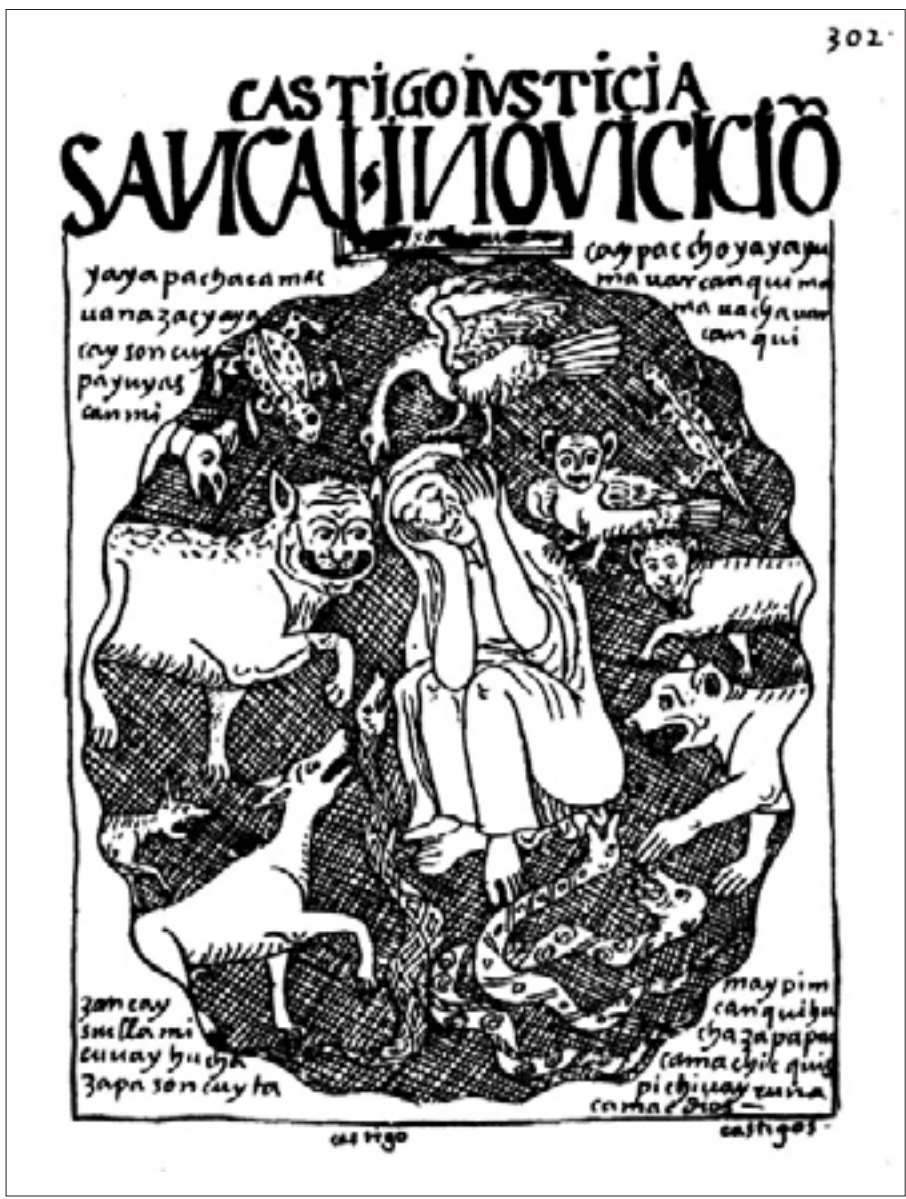
Figura 9. Castigo, justicia, Sancay, Inquisición, f. 302 [304].

un palo o garrote; pero si a pesar de la semejanza iconográfica, en las últimas cuatro imágenes la nota al pie dice «soberbia», y con ello guía la interpretación del espectador hacia el vituperio, en la imagen del Quinto castigo inca (Figura 4), no hay suficientes elementos para colegir que lo que está ahí representado es un acto de justicia. Cabe señalar que, de las escenas aquí presentadas, el castigo inca es el único que conduce a la muerte del acusado y a la de toda su estirpe. Así, vemos que Guaman asocia la soberbia a la ira, como en el caso del padre colérico, pero también con la falta de caridad y de amor al prójimo, además lo contrasta con la paciencia y amor a Dios de los esclavos que aguantan la bellaquería de sus amos.