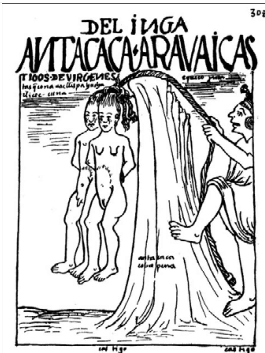
Figura 3. Castigos de vírgenes, f. 308 [310].

escenas particularmente violentas, que, como la anterior, muestran castigos, pero en este caso establecidos por los incas para sancionar a los adúlteros, a las vírgenes que rompen la castidad y a los «hechiceros». Las tres escenas tienen algo en común: todas ellas muestran maltratos físicos y, aunque en las tres aparece, en la base y fuera del rectángulo, la palabra castigo , no en todas es clara la infracción perseguida, por lo que se debe acudir a las anotaciones dentro de la lámina en donde se mencionan los delitos. Además, solo se puede conocer la condena definitiva a través del resto de notas, la mayoría de ellas en quechua, en donde se aclara que en todos los casos la pena es la muerte, aunque en todos ellos