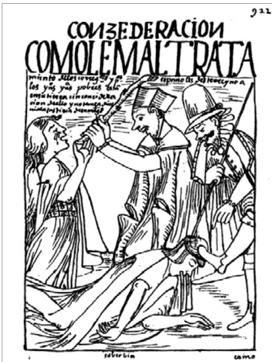
Figura 8. Maltratamiento de los corregidores y padres españoles a los indios, indias pobres, f. 922 [936].

Finalmente, tenemos que en el folio 922 [936] Guaman sintetiza en una sola imagen la soberbia de los funcionarios españoles, tanto civiles como eclesiásticos, al dibujar a un corregidor que aparece golpeando con una vara a un indio mientras lo patea y a un sacerdote que con un palo amenaza a una india que llora. El título dice: «CÓMO LE MALTRATAMIENTO [sic] de los corregidores y padres españoles deste rreyno a los yndios, yndias pobres. Están en su tierra cin concideración de ello y no teme a Dios ni a la justicia de su Magestad» 47 (Figura 8). En esta lámina, la disposición de las figuras