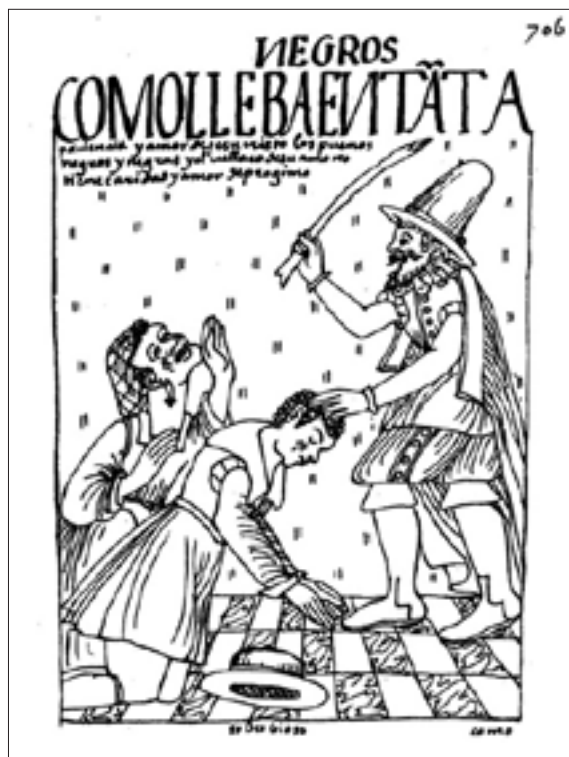
Figura 6. Cómo lleva en tanta paciencia y amor de Jesucristo los buenos negros y negras, f. 706 [720].

En la lámina 594 [608], aparece un sacerdote «muy bravo y colérico» que arremete con un palo en contra de los caciques principales y demás indios (Figura 5). En el dibujo del folio 706 [720] se contrasta la «paciencia y amor de Jesucristo los buenos negros y negras» con la bellaquería de su amo, cuando este agarra a palos a una pareja de esclavos, y demuestra, según el autor, que adolece de caridad y de amor al prójimo (Figura 6).