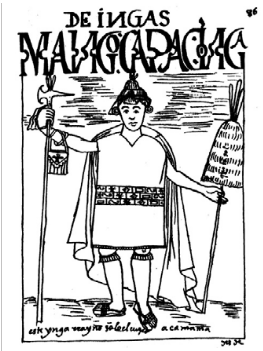
Figura 14. El primer Ynga, Mango Capac Ynga, f. 86 [86].

Pero dos de los ejemplos más notables de la incapacidad de las imágenes para transmitir la evaluación moral que Guaman hace de ellos, son los retratos del primer Inca Manco Capac (Figura 14) y el del décimo Topa Ynaga Yupanqui (Figura 15).