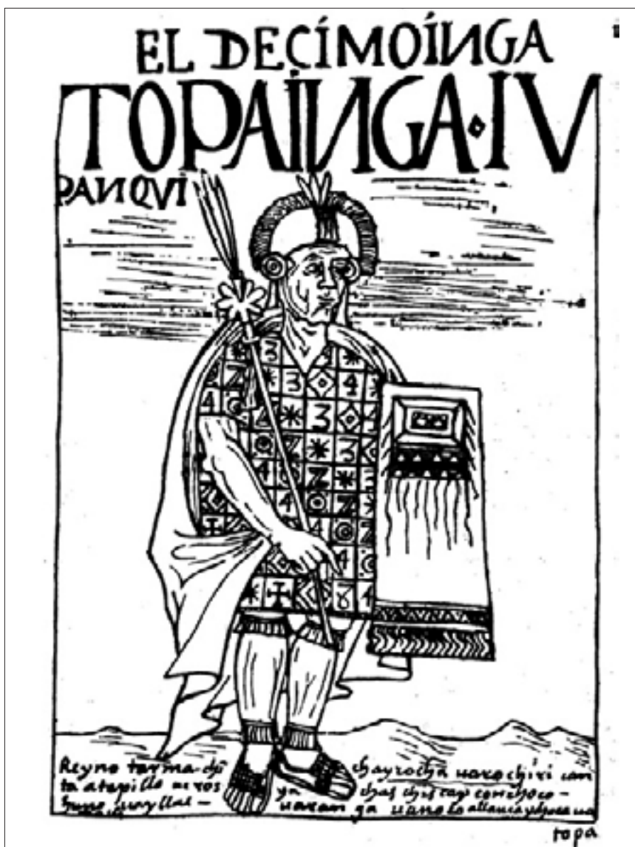
Figura 15. El octavo Ynga, Uira Cocha Ynga, f. 106 [106].

gente uaja ni son caualleros, cino picheros». 66 Con ello, Guaman hace extensivo su hostil veredicto del primer gobernante al resto de su estirpe. Pero de todos sus vicios, el más deleznable es la idolatría: «y no tubo guerra ni batalla, cino ganó con engaño y encantamiento, ydúlatras. Con suertes del demonio comensó a mochar [adorar] uacas ydulos». 67 Ninguna de estas características se presenta en la imagen del Inca, lo que nos obliga a recuperar la relación intrínseca que el autor concibió en primera instancia.