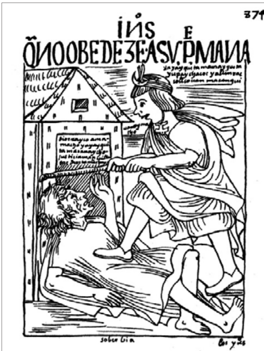
Figura 7. Que no obedece a su padre, f. 874 [888].

La siguiente lámina, 874 [888], lleva por título: «Q[UE] NO OBEDEZE A SV P[ADR]E» (Figura 7), lo que sugiere que puede tratarse de un castigo por desobediencia, y en ese caso sería justa la sanción. Sin embargo, en la imagen el indio joven apalea al anciano. La leyenda en quechua dentro de la imagen aclara que el joven no ha honrado a su padre y que lo ha golpeado con un palo. 45 Pero el sentido más profundo de la representación, que es culpar de los vicios de los indios al mal ejemplo de los españoles, se encuentra en el texto, donde Guaman señala que si el indio violentaba a su