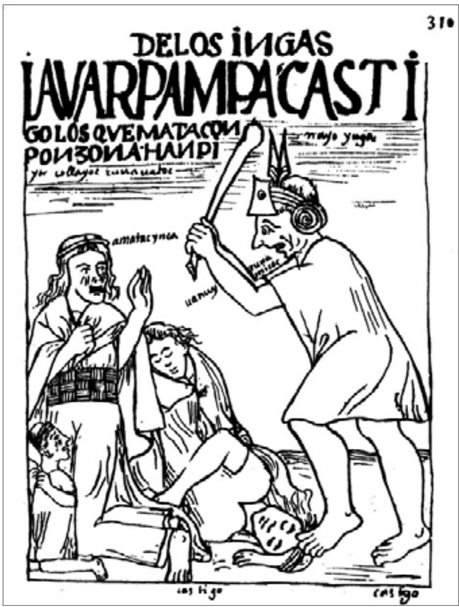
Figura 4. Castigo a los que matan con ponzoña, f. 310 [312].

curanderos y adivinos morían junto con toda su casta, no se les enterraba y eran devorados por los cóndores. 41 La lista de castigos sigue en el texto por lo menos durante tres folios más y su diversidad y crueldad son notables. Guaman enumera castigos para los señores y señoras principales en falta, para las mujeres pobres, para los borrachos, para los caballeros, para los mentirosos, para los perezosos y puercos, para los jugadores, para los desobedientes y mal criados, para los muchachos y muchachas, para los asesinos y para los traidores a la Corona. 42 De