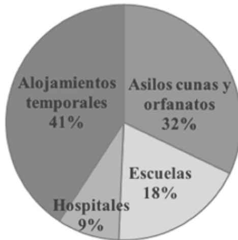
Gráfico 3. Recuento de población recogida y asilada en establecimientos de la Beneficencia durante la campaña contra la mendicidad, en el mes de septiembre de 1934. Fuente: “Población de la mendicidad hasta el 12 de septiembre de 1934”. AHSS, BB, D, AS, leg. 13, exp. 26. No se especificó a partir de qué edad se consideraron niños o adultos. Corresponden a establecimientos temporales:

el trabajo. Esto coincide con el tipo de atención que brindó la Beneficencia, pues fueron los asilos, escuelas y casas de asistencia pública los establecimientos que atendieron principalmente a los mendigos: la población de mendigos asilados en estas instituciones en septiembre de 1934, representó el 91 % del total de los mendigos recogidos (véase gráfico 3).