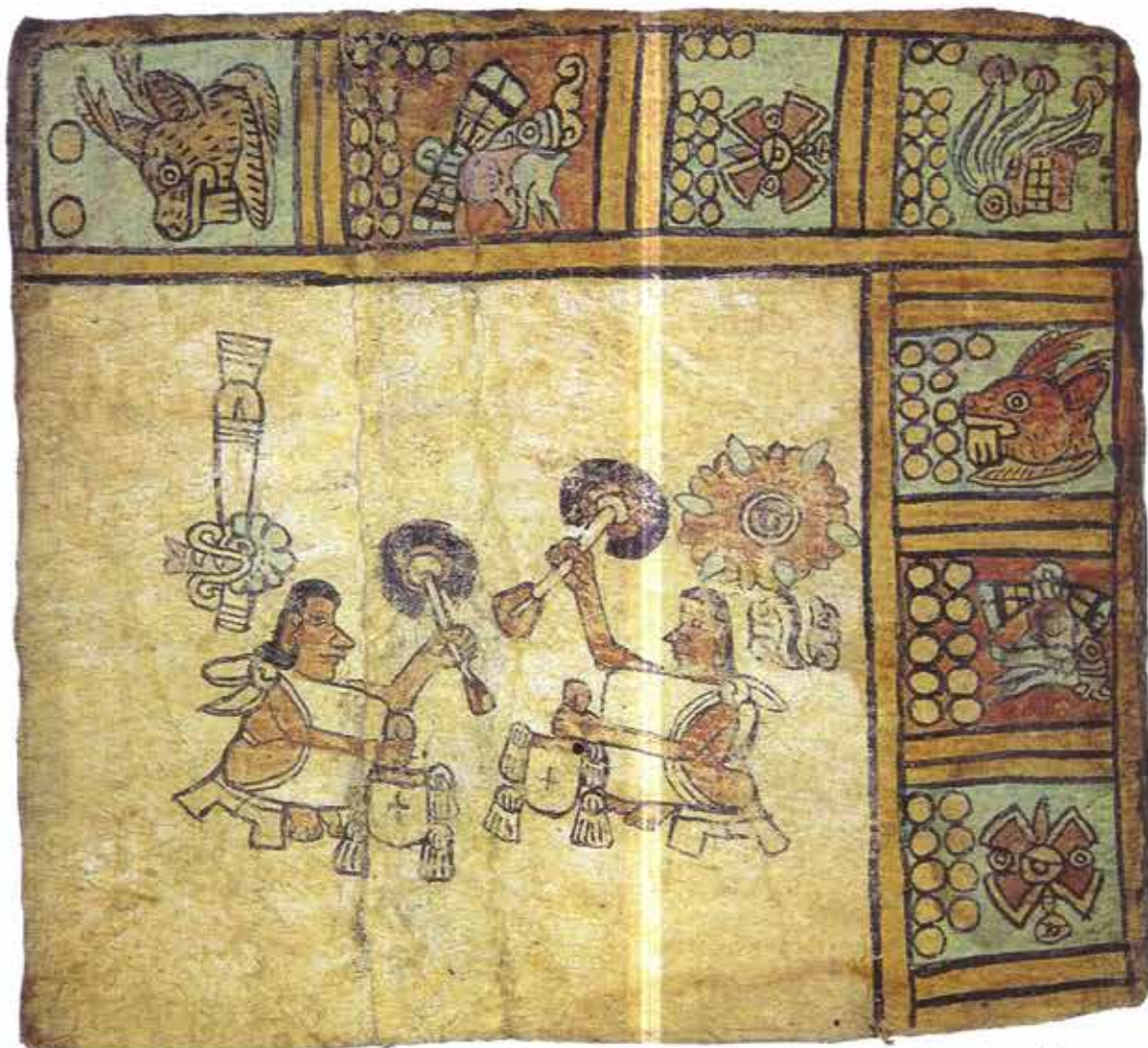
Lámina que muestra la importancia por representar el gobierno de dos señores. Códice Azoyú 1 , anverso, folio 13 (tomado de Vega, 1991)