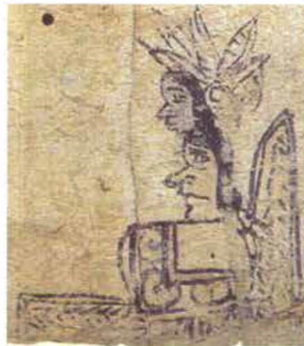
Señor Cabeza de Caracoles de Hojas. Códice Azoyú 1, anverso, folio 36 (tomado de Vega, 1991)

la naturaleza no da sus significados a las cosas; los hombres son los que los desarrollan e imponen .... Esta capacidad de otorgar significados, de 'nombrar' (dar nombre) a las cosas, actos e ideas, es una fuente de poder. El control de la comunicación permite a los administradores de ideología establecer las categorías por medio de las cuales se va apercibir la realidad.... Por consiguiente, la construcción y mantenimiento de un conjunto de comunicaciones ideológicas es un proceso social, que no puede ser explicado meramente como la actuación formal de una