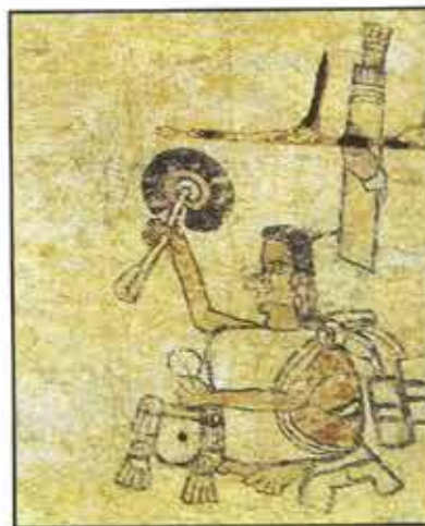
Señor Caña-Chile. Códice Azoyú 1, anverso, folio 12

En este contexto se inserta el culto católico a los santos patronos, advocaciones de las comunidades indígenas que ocupan un lugar protagónico en los complejos procesos ideológicos desencadenados por la Conquista. Las imágenes mismas de cristos, vírgenes y santos ejercieron una poderosa