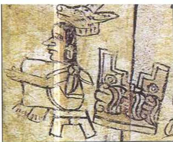
El Señor Perro en Tetenanco. Códice Azoyú 1, anverso, folio 31 (tomado de Vega, 1991)