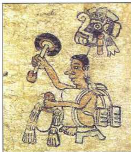
Señor Lluvia. Códice Azoyú 1, anverso, folio 5 (tomado de Vega, 1991)

Hablando de la historia colonial, resulta sumamente interesante estudiar los procesos de la