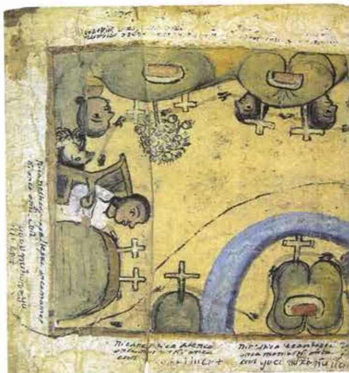
Fragmento del Mapa 2. Códice Azoyú 1, reverso, folio 3, 1 (tomado de Vega, 1991)

Si bien estoy consciente de que puede resultar polémico hablar de "ciencia" en el México prehispánico, me adhiero a la posición que afirma que uno de los principios básicos del método científico es "la construcción de un sistema basado en hechos observables cuyos resultados pueden ser