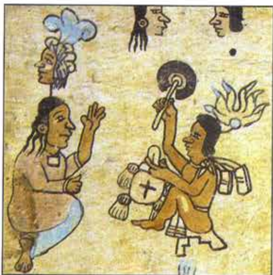
Matrimonio del Señor Llamas. Códice Azoyú 1, reverso, folio 1, D (tomado de Vega, 1991)

En años recientes he combinado crecientemente el estudio de la ritualidad y la cosmovisión prehispánicas con la etnografía de las fiestas indígenas en la actualidad . El interés por estos temas fue mi punto de partida al iniciar el estudio del culto prehispánico hace muchos años, pero en cuanto a la gran cantidad de datos etnográficos existentes, me perdía en los detalles, y los trabajos sobre "sincretismo" y "aculturación" que existían entonces, me resultaban insatisfactorios. En años recientes, se han hecho avances en estos campos y se ha acumulado abundante información etnográfica acerca de cosmovisión y ritualidad. También se ha avanzado en la investigación acerca de las instituciones religiosas y las creencias indígenas durante la Colonia, la labor de los órdenes, la creación de las cofradías, las jerarquías